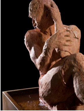
Selemno 2009, Travertino persiano cm. 163x73x170

Il percorso espositivo, che mette in rapporto le sculture antiche presenti nel Museo e le sculture di Zucconi, è pensato come "via dolorosa" verso la Pietà Rondanini custodita nell'ultima sala.